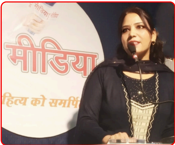
टू मीडिया में काव्य पाठ करते हुए।