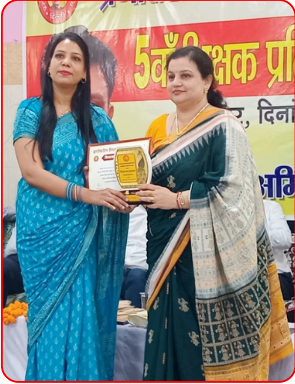
2024 में शिक्षक न्याय मंच द्वारा सर्वश्रेष्ठ शिक्षिका का सम्मान प्राप्त हुआ।