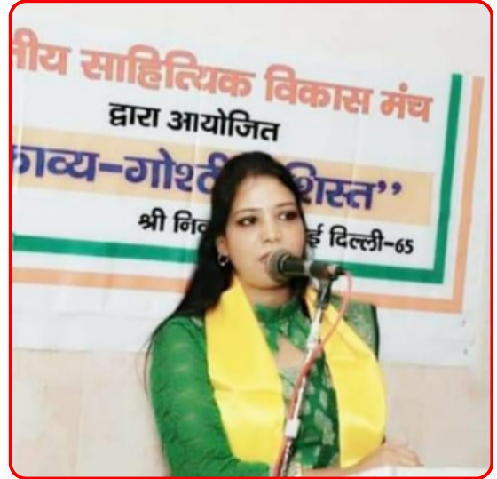
साहित्यिक विकास मंच पर काव्य पाठ करते हुए।