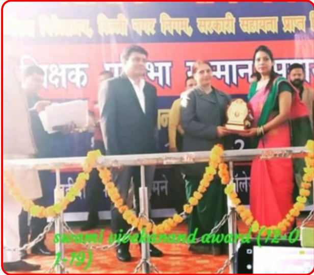
शिक्षक न्याय मंच द्वारा सर्वश्रेष्ठ शिक्षिका का पुरस्कार प्राप्त करते हुए।