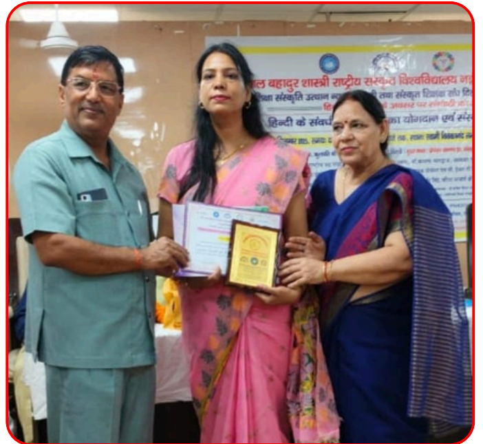
2025 में संस्कृत शिक्षक संघ द्वारा सर्वश्रेष्ठ शिक्षिका का पुरस्कार प्राप्त करते हुए।